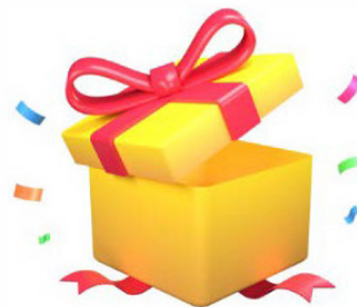
caja de premios